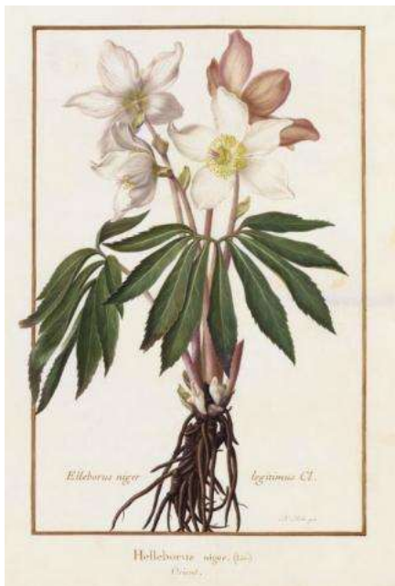
Nicolas Robert, Helleborus niger Linné, 17 es , gouache sur vélin.

L'hellébore noire, noire pour la couleur de ses racines, est utilisée depuis l'antiquité comme plante médicinale. Hippocrate l'administrait comme laxatif et diurétique. La poudre de ses racines provoquant des éternuements était réputée expulser les maladies et les mauvais esprits. Pline écrit qu'elle sert à purifier les habitations des miasmes délétères. La Fontaine y fait allusion dans sa fable du lièvre et la tortue qui le défie à la course : « ma commère, il faut vous purger avec quatre grains d'hellébore... ». (La posologie était à l'époque d'un ou deux grains contre la folie).