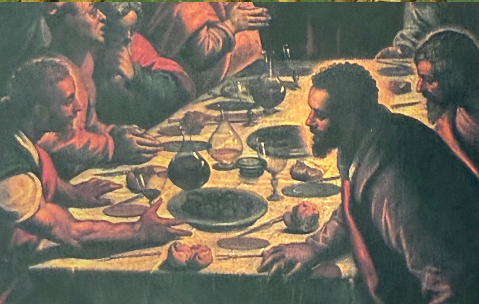
T intoret, La Cène Venise, 1592. Lucques, église San Martino.

Cette Cène de Tintoret, traduite en termes profanes, nous restitue une bruyante réunion d'hommes dans la Venise de la fin du XVI e siècle. La table, comme celle de la figure 114, est recouverte d'un tapis d'Orient et d'une nappe. Les convives mangent sur des tranchoirs circulaires ; ils ont chacun un couteau à lame fine et une fourchette à deux dents dont ils se servent comme d'une pique pour porter les mets à leur bouche sans se salir. Entre les deux grands plats on aperçoit aussi une salière. La verrerie — des grandes coupes à pied et des carafes — est de très grande qualité : on peut noter que ces coupes et ces carafes sont toutes du même modèle, constituant ce que nous appellerions de nos jours un service. Au fond à gauche, on entrevoit un buffet d'orfèvrerie composé de grands plats superposés verticalement sur des tablettes.