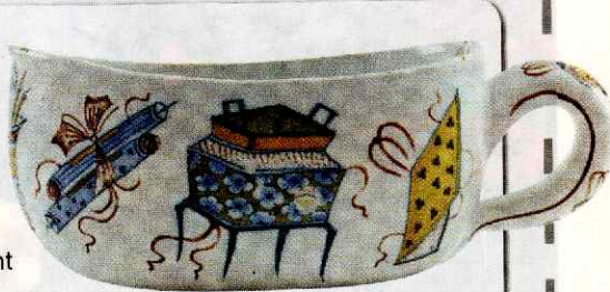
▲ Bourdaloue à anse en faïence de Rouen. Décor polychrome dans le goût asiatique. 18 e siècle. L. 19 cm.

Les sermons du père Bourdaloue étaient connus, au 17 e siècle, pour leur longueur. Les dames, prévoyantes, emportaient discrètement avec elles un pot de chambre de forme oblongue, rappelant la saucière par sa silhouette et présentant un rétrécissement au centre. C'est pour se moquer du prédicateur jésuite de Louis XIV que ce nom populaire fut donné à cet accessoire d'hygiène.